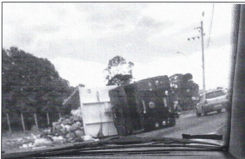
Foto 1 – Caminhão tombado próximo ao loteamento Maria Santa, em 15 de janeiro de 2022.